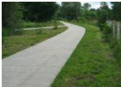
1. Rue du Moulin