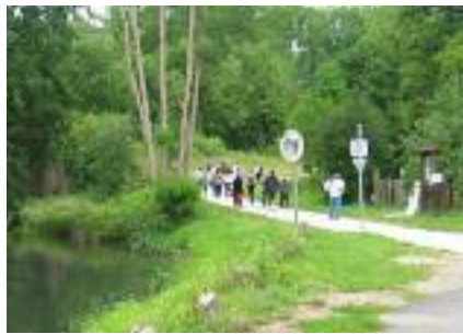
1. Solumont (pont)