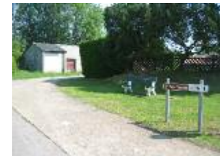
9. Ethe (chemin touristique)