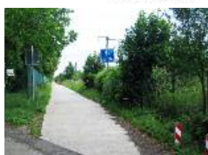
4. Solumont (golf)