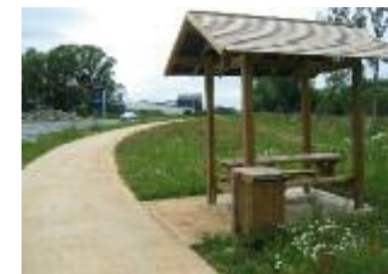
6. Carrefour zoning Ruelle