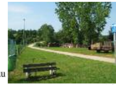
3. Ethe (football)